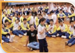
交流生與我們一同上課