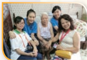
義工探訪老人情況