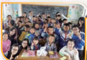
同學到中國內地作山區服務學習