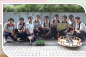
科技顯六藝創意比賽