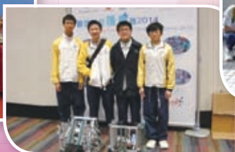
同學到海外參加資訊科技比賽