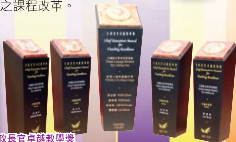
中文科獲得行政長官卓越教學獎