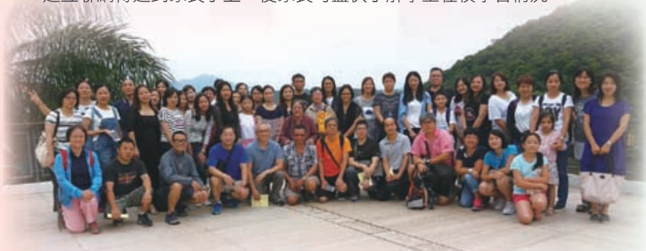
家長們一同參與中一迎新營