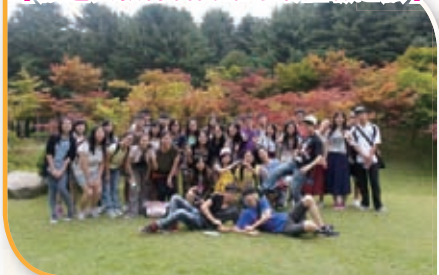
【旅遊與款待科高雄考察體驗之旅】