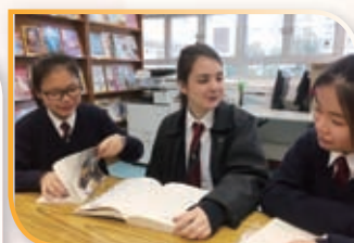
交流生與我們一同上課