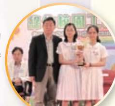
多年獲得綠色校園工程獎