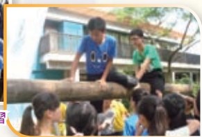
同學參與領袖訓練營