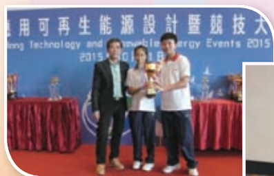
中學基建模型創作比賽