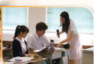
交流生與我們一同上課