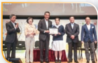
香港齊心基金會及百仁基金舉辦中文辯論比賽勇奪全港冠軍及最佳辯論員