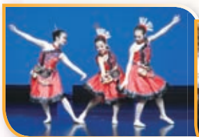
本校中國舞組屢獲獎項