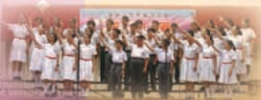
同學參加普朗匯朗誦比賽