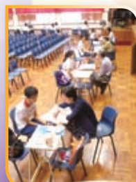
生涯規劃個別輔導