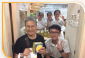
中秋節派月餅予區內老人