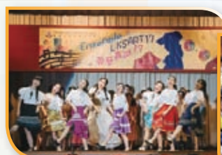
交流生與我們一同上課