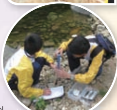
同學在校外進行專題研習