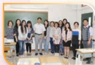
多年來參與課程發展處「種籽計劃」