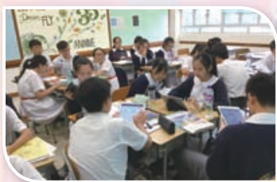
於課堂進行電子學習