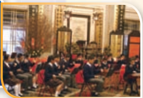
本校中樂團到東華三院參與匯演