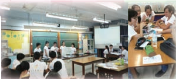
同學參與STEM+領袖力培訓活動