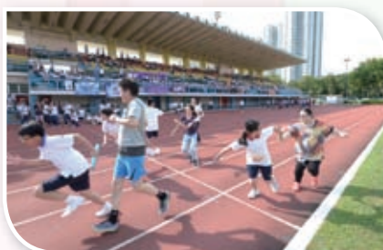
親子接力賽，增進親子關係