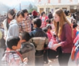
交流生與同學們一同到中國內地作服務學習